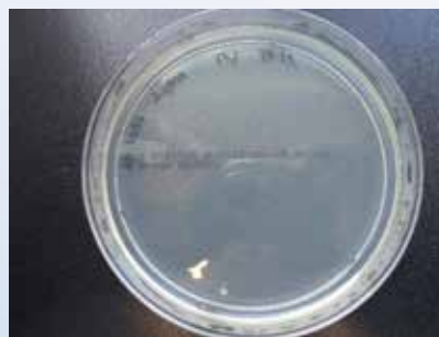
Bild 2: ML-1215XSM414 mit E-Koli nach 24h nur noch 1,2 \times 10^2