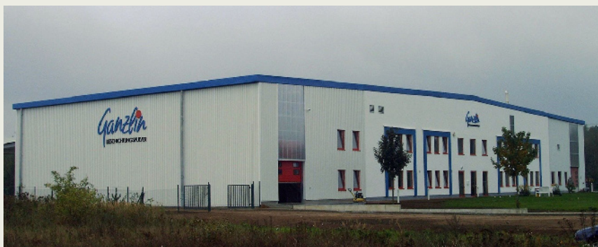
▲ Ausgebaut: Seit der Firmengründung 1993 ist die Nachfrage nach Pulver aus Ganzlin stetig gestiegen – und erforderte größere Fertigungskapazitäten

Kontakt: Ganzlin Beschichtungspulver GmbH, Ganzlin, Tel. 038737 303-0, info@ganzlin.com, www.ganzlin.com